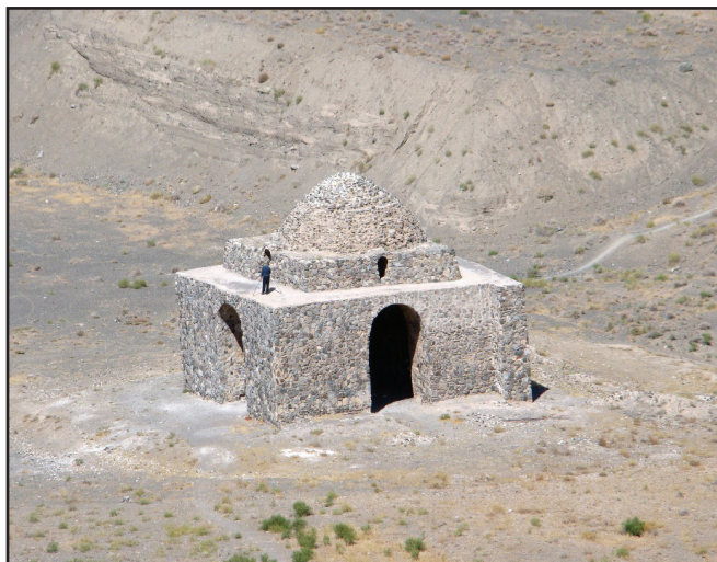
تصویر ۱. جبهه جنوبی چهارطاقی بازه هور.

چهارطاقی بر روی تپه‌ای ساخته شده که حدود ۱۳ متر از سطح جاده مزبور بلندتر است و دسترسی به سطح آن امروزه از طریق راهی خاکی بر دامنه غربی تپه امکان‌پذیر است. بر سطح تپه، قطعه سفال‌های دوره ساسانی و اوایل دوران اسلامی پراکنده است. قبل از شروع کاوش مجموعه سفال‌های سطحی، مورد بررسی روشمند قرار گرفت و کم و کیف پراکندگی آنها مبنای ایجاد برخی از کارگاه‌های کاوش واقع شد.