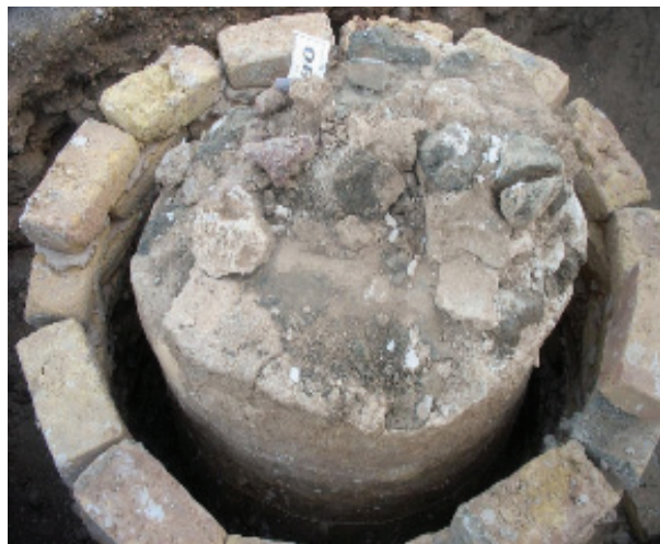
تصویر ۷. نحوه حفاظت از یکی از عناصر معماری مکشوفه قبل از پر کردن گمانه.