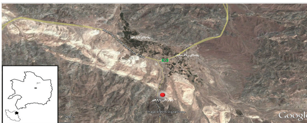
تصویر ۲. موقعیت چهارطاقی بازه هور نسبت به روستاهای رباط سفید، بازه هور و جاده مشهد - تربت حیدریه.

چهارطاقی بازه هور در فاصله ۷۵ کیلومتری جنوب شرق مشهد و در جانب شرقی راه قدیمی که خراسان را با سیستان و کرمان مرتبط می ساخته است، واقع شده است. روستای رباط سفید در ۱/۵ کیلومتری و روستای بازه هور در ۳ کیلومتری چهارطاقی، نزدیکترین آبادی‌ها به بنا هستند. (تصویر ۲) آن‌گونه که افضل‌الملک به سال ۱۳۲۱ق در سفرنامه خویش مسطور ساخته، نام بازه هور مرکب است از دو جزء که جزء اول آن به اصطلاح اهالی مشهد به معنای دهنه بین دو کوه و تنگه است و جز دوم به پارسی، «خورشید» معنا می‌دهد (افضل‌الملک، بی تا: ۱۳۰). به فاصله حدود ۳۵۰ متری جنوب غرب چهارطاقی، گردنه کوهستانی قرار گرفته که بر فراز آن قلعه‌ای موسوم به قلعه دختر، بر راه و بر چهارطاقی بازه هور اشراف کامل دارد.