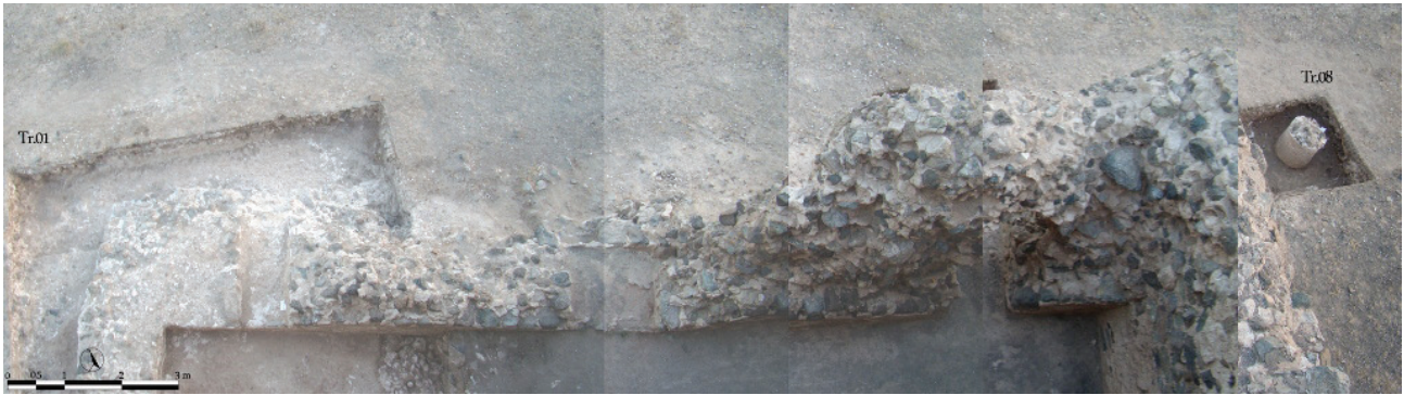
تصویر ۴. دالان شمالی چهارطاقی پس از کاوش. گمانه ۱ در سمت چپ و گمانه ۸ در سمت راست تصویر مشاهده می‌شوند.

ورودی اصلی چهارطاقی، همان ایوان جنوبی بوده است. در نتیجه کاوش در شرق بنا در محدوده گمانه‌های ۸، ۹، و ۲۱ آثاری از دو ستون و دیوار مرتبط با آنها شناسایی شد که احتمالاً گویای وجود یک تالار ستوندار در جنب بنا است. دیگر گمانه‌های فصل اول کاوش، گمانه‌های آزمایشی به ابعاد یک در یک متر بودند که برای یافتن شواهد احتمالی از فضاهای معماری وابسته به چهارطاقی در فواصل متوالی ایجاد شدند. تقریباً تمامی گمانه‌های آزمایشی فاقد آثار و لایه‌های فرهنگی بودند و نشانگر محوطه‌های هستند که احتمالاً فضای سبز اطراف چهارطاقی بوده است. (تصویر ۵)