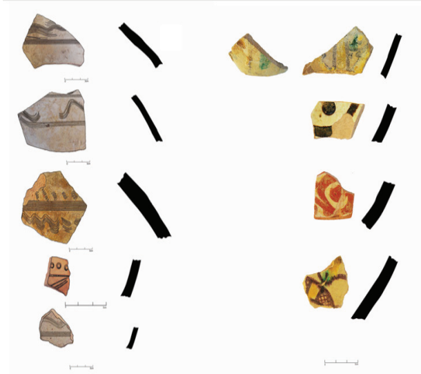
تصویر ۶ نمونه‌هایی از سفال‌های یافت‌شده که گویای سنت سفالگری اواخر دورهٔ ساسانی و اوایل دوران اسلامی هستند (طراحی: ماریا داغ‌مهچی).

جنبه‌های هنری و زیبایی‌شناختی اثر فکر کنند، صرفاً در اندیشهٔ ایجاد پوششی برای چهارطاقی بازهٔ هور بوده اند. به هر حال یافتن پاسخ این سؤال نیز با انجام مطالعات آزمایشگاهی، تاریخ‌نگاری مطلق بنا و یافتن مدارک بیشتر دربارهٔ تاریخ سازه و وقایع تاریخی منطقه تحقق خواهد یافت.